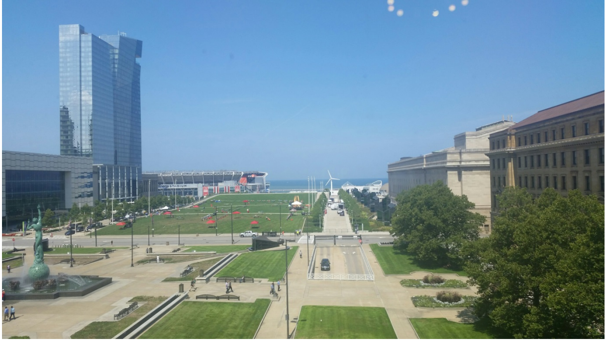
Utsikt från Cleveland Public Library.

Jag är väldigt glad att jag fick möjligheten att delta i WLIC Columbus 2016. Konferensen har gett mig massor av nya tankar och idéer och nya kontakter.