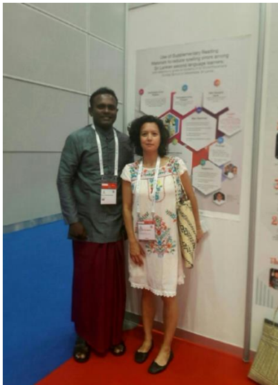
Bild 9 Jag och en skolbibliotekarie från Sri Lanka hade ett intressant samtal

https://tidningensyre.se/2018/nummer-305/han-dokumenterar-flyktingarnas-berattelser/