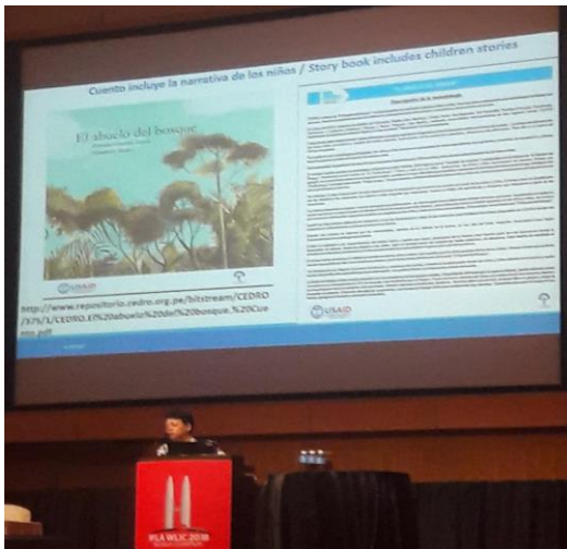
Bild 4 Bibliotekarie från Colombia

Färgerna, dofterna, ljuden, människorna, byggnaderna och värmen var som en explosion. Jag blev helt betagen i denna underbara huvudstad. Och trots att jag inte kände någon var jag aldrig ensam. Folk på gatan pratade med en och på själva IFLA-konferensen förstås. På själva konferensen var det lite förvirrat, det fanns ju så många intressanta samtal att lyssna på och så många människor att prata med. Men eftersom jag inte kunde gå på allt valde jag några föreläsningar (eller sessioner som det kallas) som fängade mitt intresse: