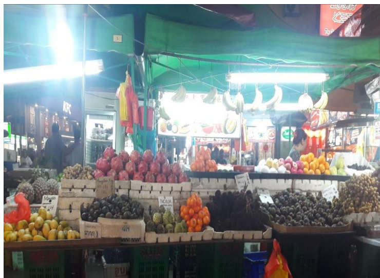
Bild 2 & 3 På marknaden