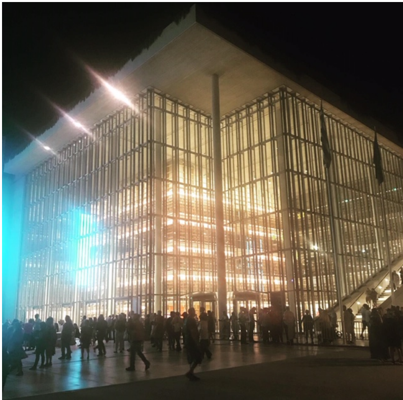
Privat bild, nationalbiblioteket i Aten 2019

Utöver alla spännande föreläsningar är definitivt nätverkandet en väldigt viktig del av konferenserna. Det blir många intressanta möten med internationella kollegor som ger nya perspektiv och lärdomar. I år har jag exempelvis knutit kontakt med ett teknologiskt bibliotek från Sibirien (!) talat med en bibliotekarie från Nigeria om bevarande av samlingar hot mot