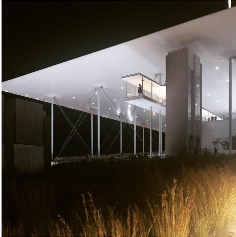
Privat bild, nationalbiblioteket i Aten 2019

Sammanfattningsvis har jag hunnit med två möten inom sektionen, deltagit under många inspirerande och intressanta föreläsningar, nätverkande med kollegor från delar av världen som jag förmodligen inte träffat på utan denna möjlighet att mötas under konferensen, jag vill därför rikta ett stort tack till Svensk biblioteksforening som beviljade mig ett resestipendium för att ta del av konferensen, tack!