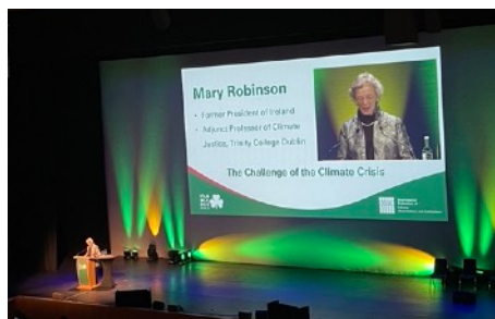
Mary Robinson talar.

Årets konferens, som också är den första jag någonsin deltagit i, avhölls i Dublin – en stad som det är lätt att tycka om. Det är storstad med viss småstadskänsla och en plats som ekar av historiens vingslag men som ändå känns ung och ganska modern. Närheten till havet och storslagen natur gör det inte sämre. Konferenscentret där WLIC rumsterade var ett ställe av modernt konferensstug, anonymt men effektivt. För en nybörjare i dessa sammanhang var det ganska överväldigande att se två tusen människor inom bibliotekssektorn från hela världen samlade på ett och samma ställe. Det var en häftig och nästan lite rörande känsla som värmdde mitt lätt dammiga bibliotekariehjärta. Under de dagar som konferensen pågick hann jag med ett otal olika seminarier, samtal och debatter och här följer några nedslag i utbudet.